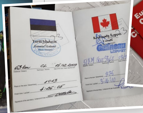
Do preukazu zbierate pečiatky za účasť na pretekoch, s desiatimi sa v svetovej sérii stávate majstrom.