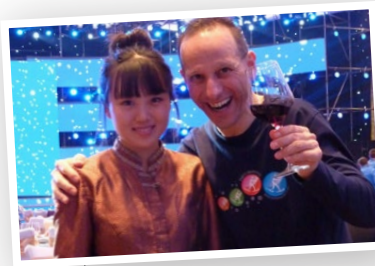
Na Vasovom behu v Číne.

Nová vašeň ho opantala. Bielou stopou sa začala veľká sága. Objavil dva medzinárodné sériové podujatia: Worldloppet a Euroloppet. V prvom po odbehnutí 10 bežeckých maratónov získavate titul majstra Worldloppet. Aspoň jeden absolvovaný pretek sa musí konať na inom kontinente. V európskej verzii na obdobný titul potrebujete osem účastí. V rámci svetovej série je František už trojnásobným majstrom, v európskej verzii drží dva tituly.