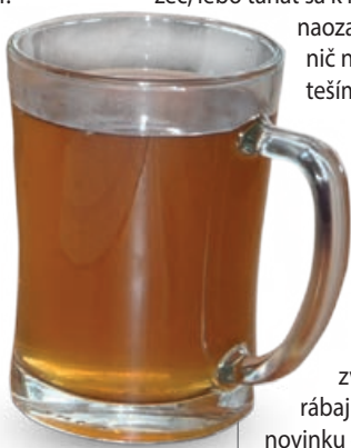
TATRANSKÝ CHATOVÝ ČAJ AKO PRVÁ POMOC V ZIME.