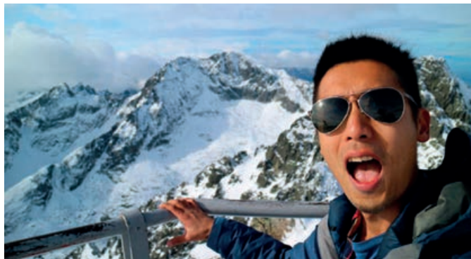
Z RŮZNYCH UHLOV.