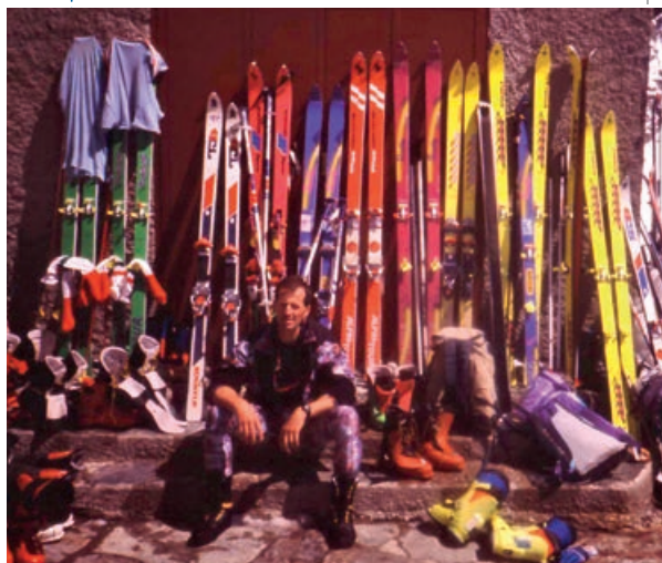
ATMOSFÉRA 80-YCH ROKOV JE NEZAMENITEĽNÁ I V ŠPORTE.

Dal mi dva horčíčky s vodkou so slovami aj tak umrieš, a tie asi urýchlili rozhodnutie. Pustil som sa dole a skončil na Brnčálke. Napriek jadrovému mraku dodnes som stále tu a dúfam, že ešte nejaký ten čas ostanem (úsmev ...).