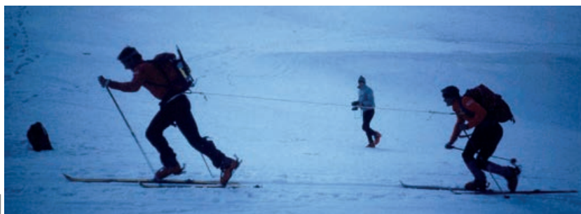
PRETEKALO SA S LANOM. ĀBY NEZAVADZALO, POSLŪŽIL TAJNÝ TRIK, GUMIČKY.