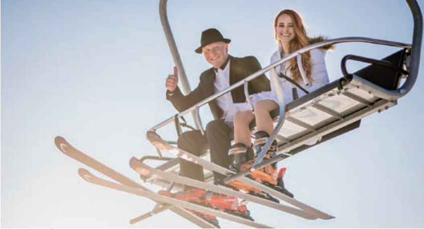
NIEKTO SI SVADOBNÉ FOTO ROBÍ PRI STUDNI, BEKEŠOVCI NA LYŽIACH.