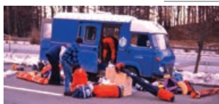
ABSURDITY SOCIALIZMU. NÁKUP A PRENOS „ZÁPADNÉHO“ TOVARU.

A to je aj idea nášho športu. Ten, kto chce preraziť, musí trpieť viac ako súperii.