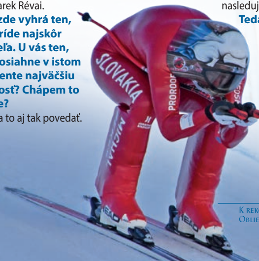
K REKORDU POMOHLA NOVÁ KOMBINEŽA. OBLIEKANIE DO NEJ TRVÁ HODINU.