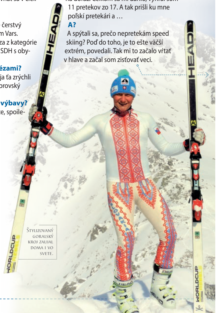
ŠTYLIZOVANÝ GORALSKÝ KROJ ZAUJAL DOMA I VO SVETE.