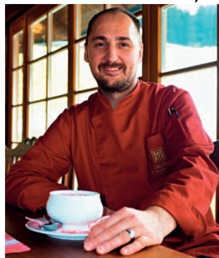
KUCHÁR BRAŇO ADAMEC O PRÍPRAVE BORŠČU Z JASNEJ HOVORÍ, ŽE JE O TRETINU NÁROČNEJŠIA AKO BEŽNÉHO. ČO SA TÝKA ÚKONOV, AJ POUŽITIA SUROVÍN.

6. Mark do boršču nedáva ani zemiaky, hoci pri iných jedlách ich má rád. Smotanu dáva na oddelený tanierik , aby si jej každý dal množstvo podľa svojej chuti.