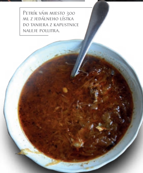
PETRIK VÁM MIESTO 300 ML Z JEDÁLNEHO LÍSTKA DO TANIERA Z KAPUSTNICE NALEJE POLLITRA.

som videl viackrát, tu sa odrhlo bralo, bol to moment,“ spomína.