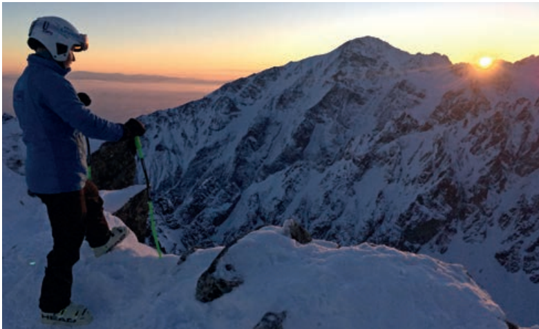
ROMANTIKA PO TRÉNINGU NA DOMOVSEJ TRATI V TÁTRÁCH.