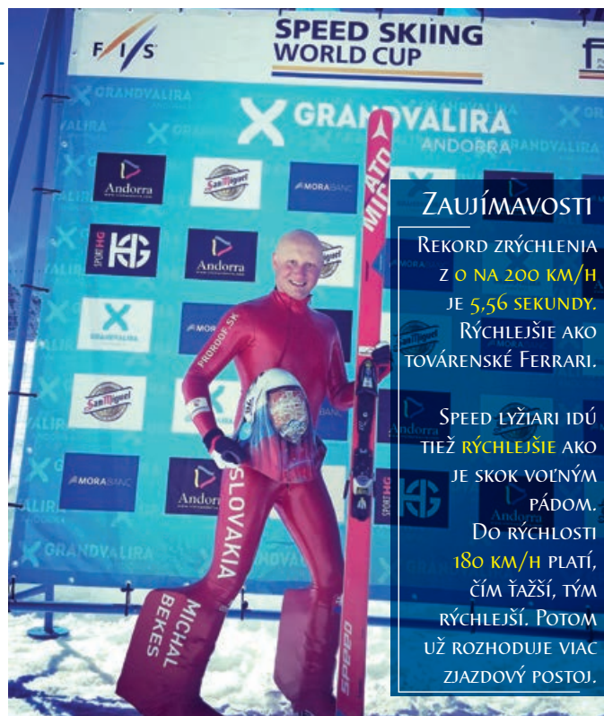
UŽ VIETE, NA ČO MÁ FORMULA I SPOILERY?

Z druhého ma ale diskvalifikovali, lebo na kombinézu