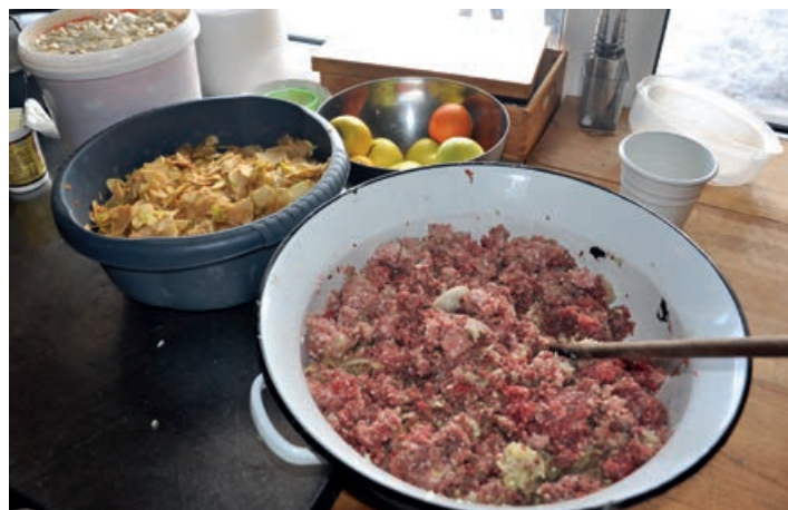
KTO SA HROZÍ EČOK, NA ZELENOM PLESE SI VYDÝCHNE.