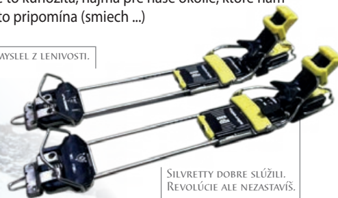
SILVRETTY DOBRE SLUŽILI. REVOLÚCIE ALE NEZASTAVÍŠ.