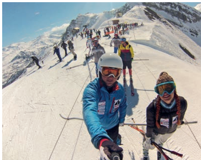
TAKTO TO VYZERÁ NA VRCHOLE SLÁVNEJ ZJAZDOVKY VARS.

A spýtali sa, prečo nepretekám speed skiing? Pod' do toho, je to ešte väčší extrém, povedali. Tak mi to začalo vrtať v hlave a začal som zisťovať veci.