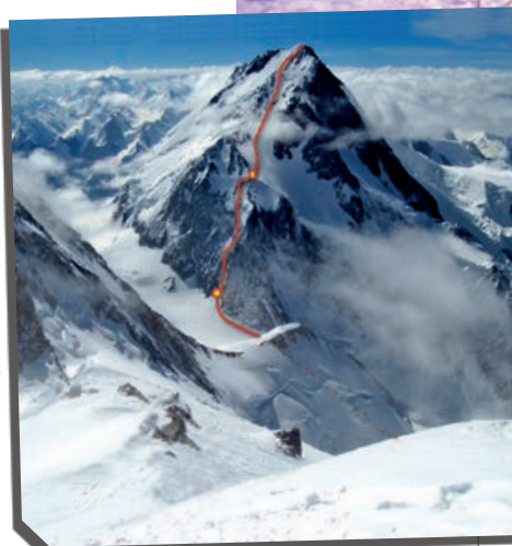
A PREČO POTOM NIE AJ OSEMTISÍCOVKY? GÁŠERBRUM.

Do lanovky som nastúpil tretikrát a zvažoval severnú trasu Nemeckým rebríkom. Aj keď som váhal.