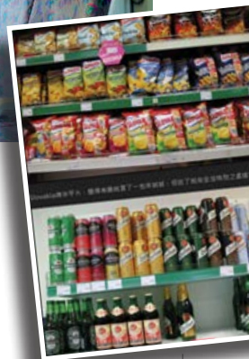
V SLOVENSKEJ REPORTÁŽI BY SA TIETO SNÍMKY ASI NEOBJAVILI. PRE TAJVANSKÉ PUBLIKUM SÚ ALE VEĽKOU KURIOZITOU.