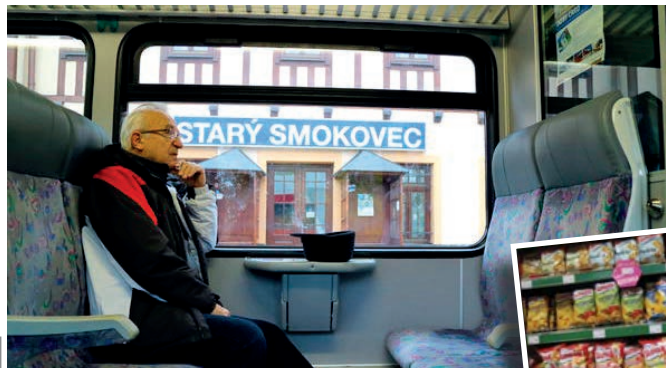
LEEHOVO FOTOGRAFICKÉ OKO UKAZUJE TALENT A KVALITU. PRISPELI K ŠÍŘENÍU BLOGU

díl viacero túr. V jesennom studenom počasi sa v krátkych nohaviciach napríklad vybral na Skalnaté Pleso a Lomnický štít. Po návrate mu preventívne dali tatranský čaj.