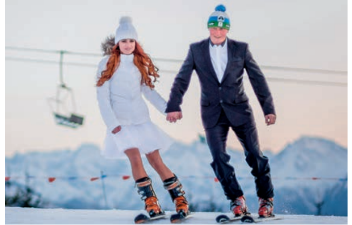
NA LYŽIACH SA DVOJICA AJ ZOZNÁMILA.