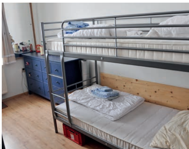
TU PREBÝVA PO ROBOTE TÍM CHATY. OBNOVA UBYTOVNE PRE ZAMESTNANCOV BOLA PRIORITOU.