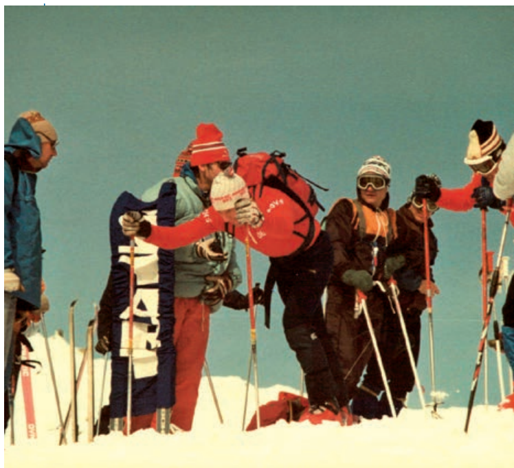
ŠTART SLÁVNÝCH PRETEKOV NA ĎUMBIERI